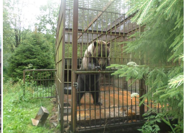
Potap som bor bredvid Fennya lever också ett tragiskt liv, men han har en större bur där han kan röra sig mer än Fennya kan. Men självklart lever dessa stackars björnar ett fruktansvärt liv....