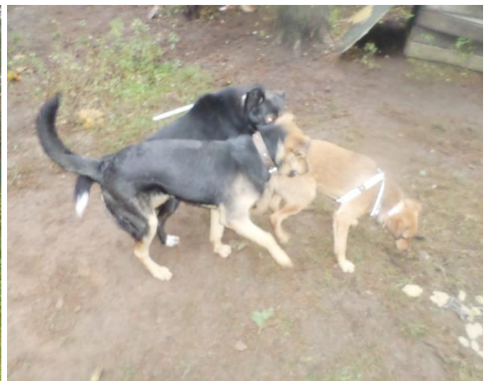
Några av de räddade hundarna som nu busar hos Elena.